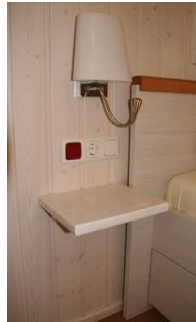
Schlaf-, Wohnraum Notfallalarm am Bett