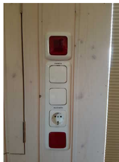
Notfallschalter im Eingangsbereich mit Notfallleuchte