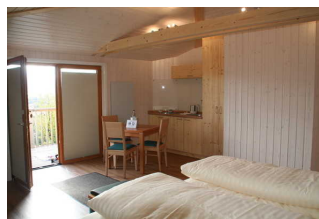
Schlaf-, Wohnraum Baumhaus Ahornhöhe (Blick auf Eingangstür)