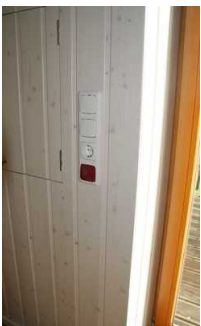
Schlaf-, Wohnraum Notfallalarm an der Eingangstür