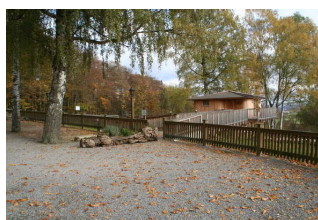
Zugang zum Baumhaus