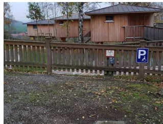
Gekennzeichneter Parkplatz vor dem Baumhaus

Es ist ein allgemeiner Parkplatz vorhanden.