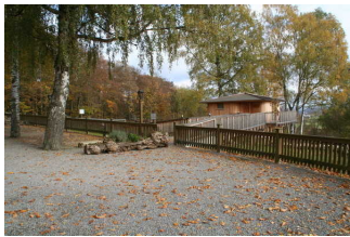
Parkplatz am Baumhaus Ahornhöhe