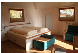
Schlaf-, Wohnraum Baumhaus Ahornhöhe (Blick auf Bett und Sofa)